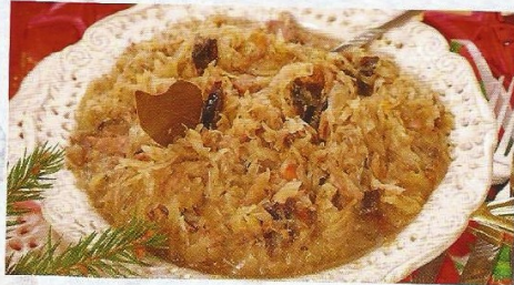
Tradycyjne potrawy wigilijne